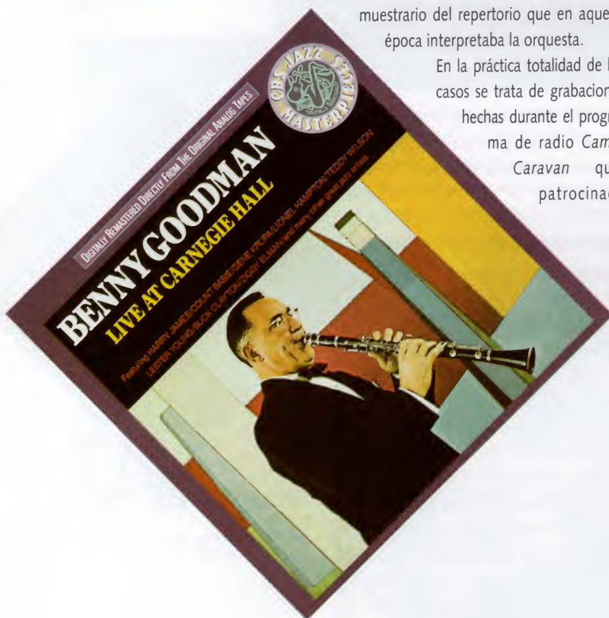
La más reciente edición americana del Concierto del Carnegie Hall.

El título del primer álbum es algo engañoso por lo del "Nº2". La explicación estriba en que al publicar por primera vez en 1950 el concierto del Carnegie Hall , que se transformó en inmediato éxito de ventas, la Columbia, para aprovechar el tirón, decidió editar a continuación los famosos "air-checks" de Savory y no se le ocurrió nada mejor que ponerle dicho título.